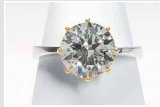
Solitär-Ring, besetzt mit 1 Diam.- Brillant, ca 4,7cts. AP 653453, Aufruf inkl. Aufgeld 57.600,- €.