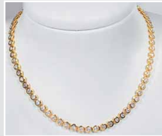
Feines Diamantcollier. Hochwertige Goldschmiedearbeit. AP 653457, Aufruf inkl. Aufgeld 14.640,- €.