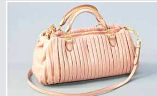
MIU MIU, topaktuelle Handtasche. AP 649681, Aufruf inkl. Aufgeld 580,- €.