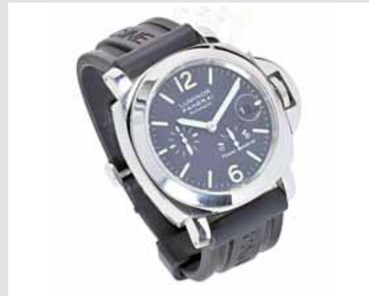
OFFICINE PANERAI, Herrenuhr »Luminor Power Reserve«, Edelstahl. AP 654964, Aufruf inkl. Aufgeld 3.500,- €.

Auflösung einer gepflegten, kaum getragenen Sammlung von Armbanduhr.