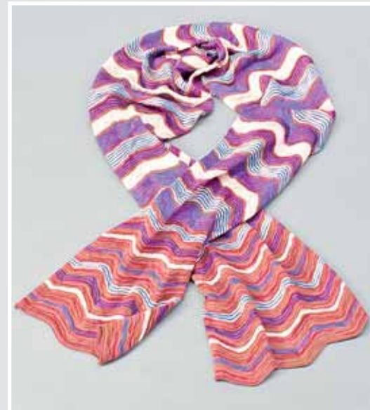
MISSONI, Strickschal. AP 653275, Aufruf inkl. Aufgeld 90,- €.