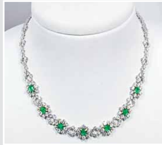
Feines Collier, Smaragde und Diam.- Brillanten. Hochwertige Goldschmiedearbeit. AP 653461, Aufruf inkl. Aufgeld 28.200,- €.

Eine sensationelle Juwelenkollektion von allerfeinster Güte. Versteigerung zu Gunsten einer Stiftung.