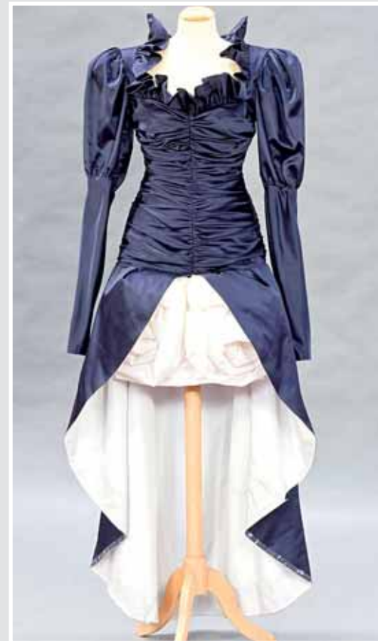
Ausgefallenes Abendkleid, dunkelblauer/cremefarbener Seidensatin, kurzer Rock mit langer Schleppe, ca. Größe 38, Original aus dem ehemaligen Modeatelier Hübner, Stuttgart. AP 654212, Aufruf inkl. Aufgeld 190,- €.