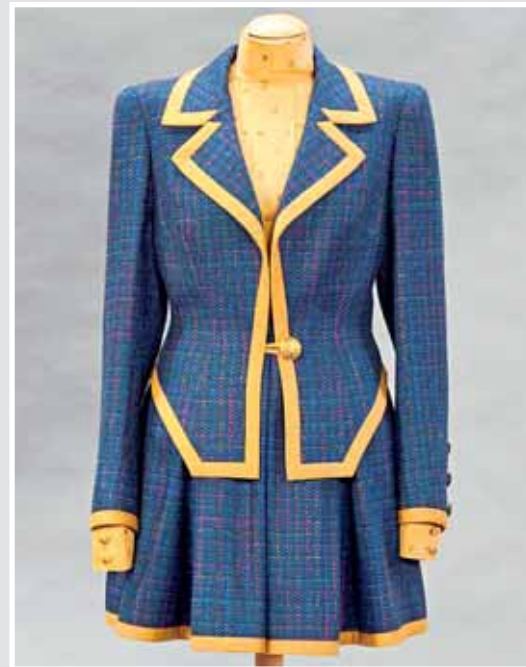
Ausgefallenes Kostüm mit passender Bluse, blauer Tweed, senffarbene Paspelierung, figurbetontes Jacket, ca. Größe 36/38. Original aus dem ehemaligen Modeatelier Hübner, Stuttgart. AP 653699, Aufruf inkl. Aufgeld 150,- €.