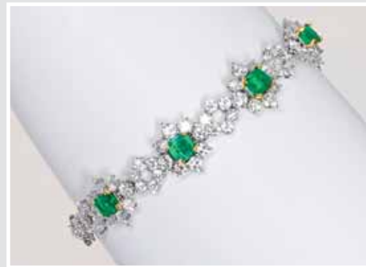
Armband, Smaragde und Diam.- Brillanten. Hochwertige Goldschmiedearbeit. AP 653462, Aufruf inkl. Aufgeld 11.400,- €.