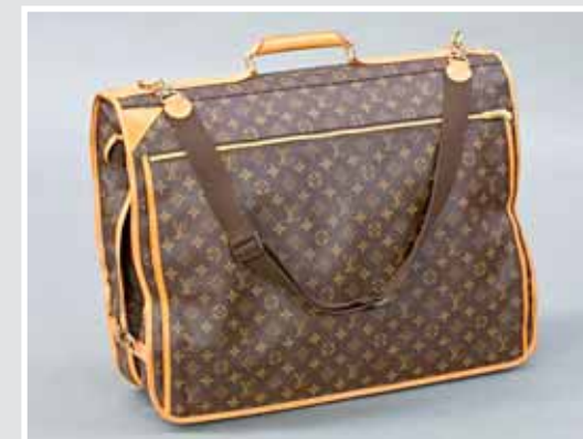
LOUIS VUITTON, Kleidersack mit zwei Kleiderbügeln. AP 652800, Aufruf inkl. Aufgeld 900,- €.