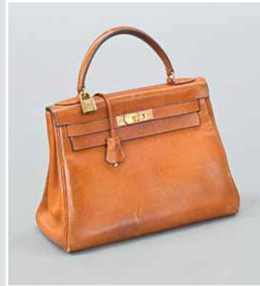
HERMES, Handtasche, Modell »Kellybag«. AP 552508, Aufruf inkl. Aufgeld 1.440,- €.