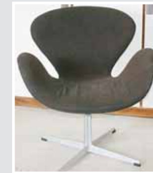
Sessel F. Hansen. Aufruf € 60,-, Zuschlag € 710,-.