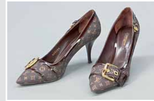
LOUIS VUITTON, Paar topaktuelle Pumps. AP 653780, Aufruf inkl. Aufgeld 120,- €.