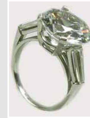
Brillantring, 11,1 cts. Aufruf € 125.000,-, Zuschlag € 150.000,-.