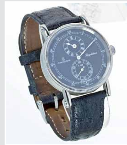
CHRONOSWISS, Herrenuhr »Régulateur«, AP 654947, Aufruf inkl. Aufgeld 2.200,- €.

Hochfeine Gold- und Silberobjekte mit russischen Punzen (teilweise mit Punzen Werkmeister Fabergé).