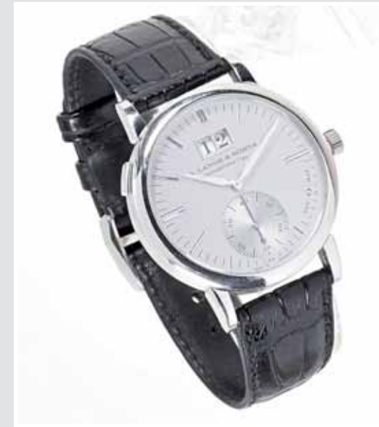
A. LANGE & SÖHNE, Herrenuhr »Langematik« Platin. AP 654957, Aufruf inkl. Aufgeld 22.000,- €.