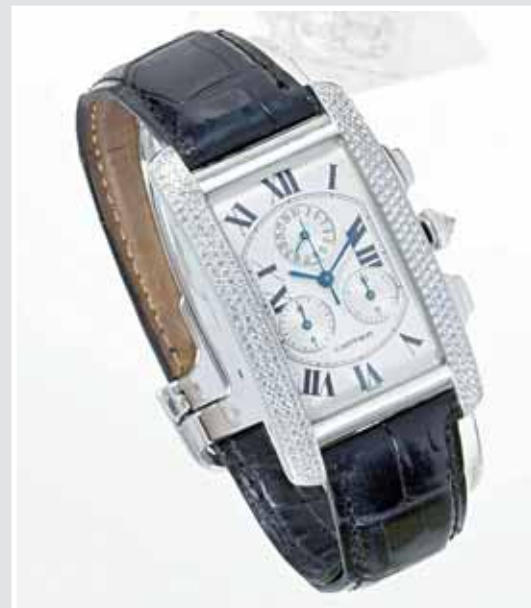
CARTIER, Damenuhr »Tank Française Chronograph«, AP 654955, Aufruf inkl. Aufgeld 7.500,- €.