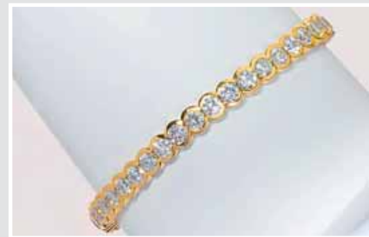
Feines Tennisarmband. Hochwertige Goldschmiedearbeit. AP 653456, Aufruf inkl. Aufgeld 17.040,- €.

Auflösung einer gepflegten, kaum getragenen Sammlung von Armbanduhr.