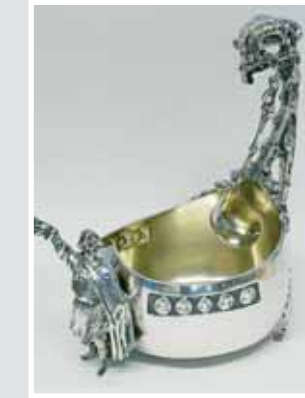
Silberner Kovsch. Aufruf € 1.500,-, Zuschlag € 21.600,-.